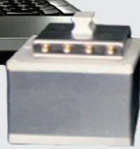
(范德堡法终端转换器)